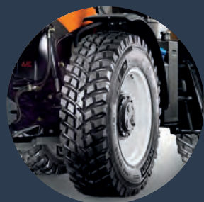
Speciální pneumatiky NOKIAN® přímo z výroby