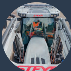
Čelní nakladače přímo z výroby