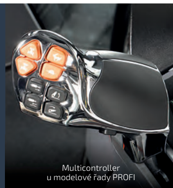
Multicontroller u modelové řady PROFI