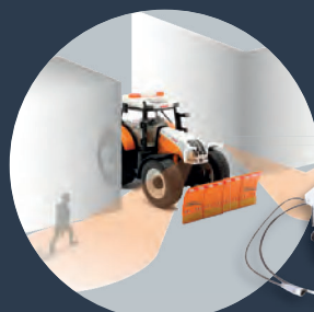
Pro bezpečný výhled je na přání možné objednat Cross-Camera-System (QKMS)